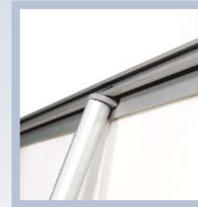
Panelstange in das Topprofil einhaken und fertig.