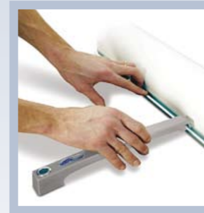
Design – durchdacht bis ins Detail. Systemfuß in das Bodenprofil einhaken.